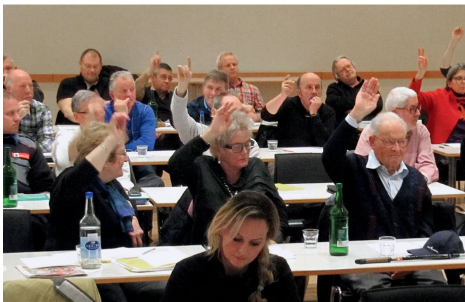
Der Zentralvorstand entscheidet sich, die Kröte zu schlucken.

Im Februar traf sich der Zentralvorstand des BSPV zu einer ausserordentlichen Sitzung. Anlass dazu gab die bevorstehende Abstimmung vom 18. Mai über das Pensionskassengesetz. Ein schwieriges Unterfangen. Doch sind sich die Vorstandsmitglieder darüber einig geworden, dass sie das Pensionskassengesetz annehmen werden.