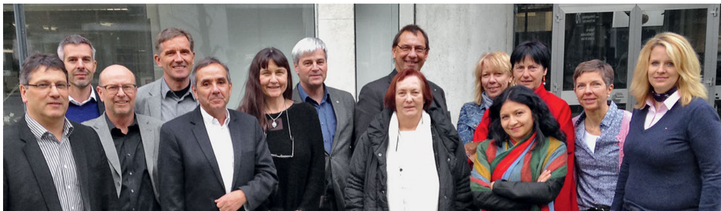
Hohe Sozialkompetenz ist gefordert.