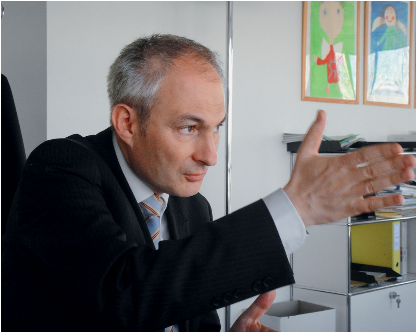
Bernhard Pulver will eine Lösung.

Am 18. Mai entscheiden die Berner Stimmberechtigten über das neue Pensionskassengesetz. Es geht um den Primatwechsel und die Sanierung der beiden Kassen.