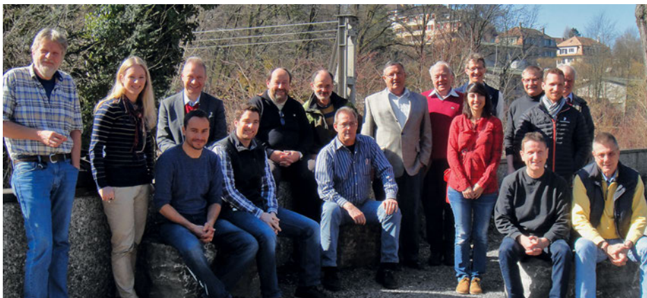
Die zuverlässige Sektion der Forstingenieure will Klarheit.

Die beschlossene Umstrukturierung beim Amt für Wald des Kantons Bern (KAWA) sorgt bei den Forstingenieuren für Unsicherheit über die zu leistende Arbeit. Die acht Waldabteilungen werden zu vier Abteilungen zusammengeschlossen. Die Stabsabteilung wird ebenfalls neu gegliedert.