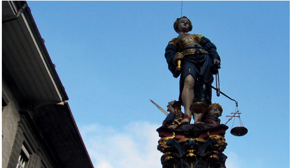
Une progression salariale équitable et transparente évite les déceptions.

De nombreux membres se sont renseignés auprès de l'APEB pour demander un recours contre cette promotion selon eux insuffisante. L'Office cantonal du personnel a apparemment également reçu bon nombre de courriers.