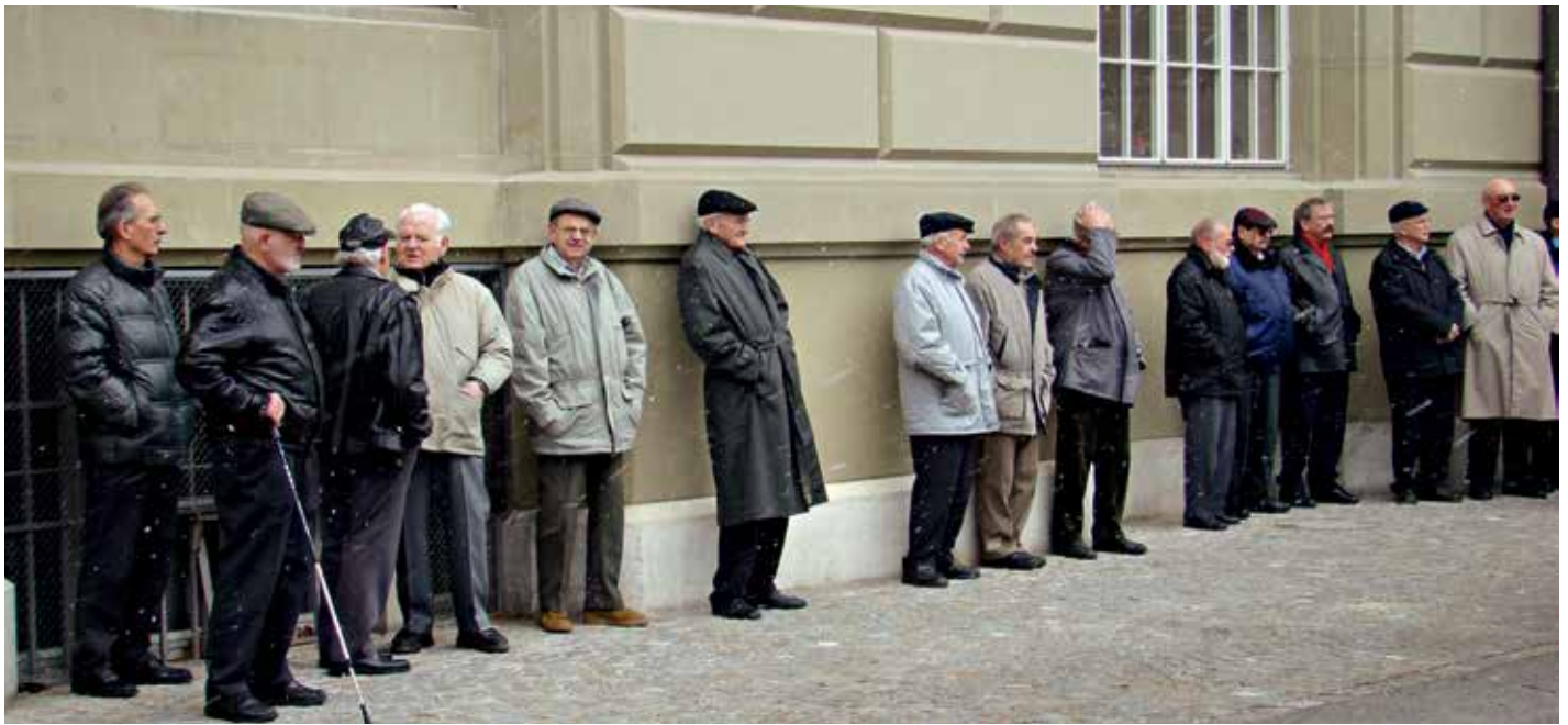
Neues PKG: Der BSPV fordert den Teuerungsausgleich auf den Renten.