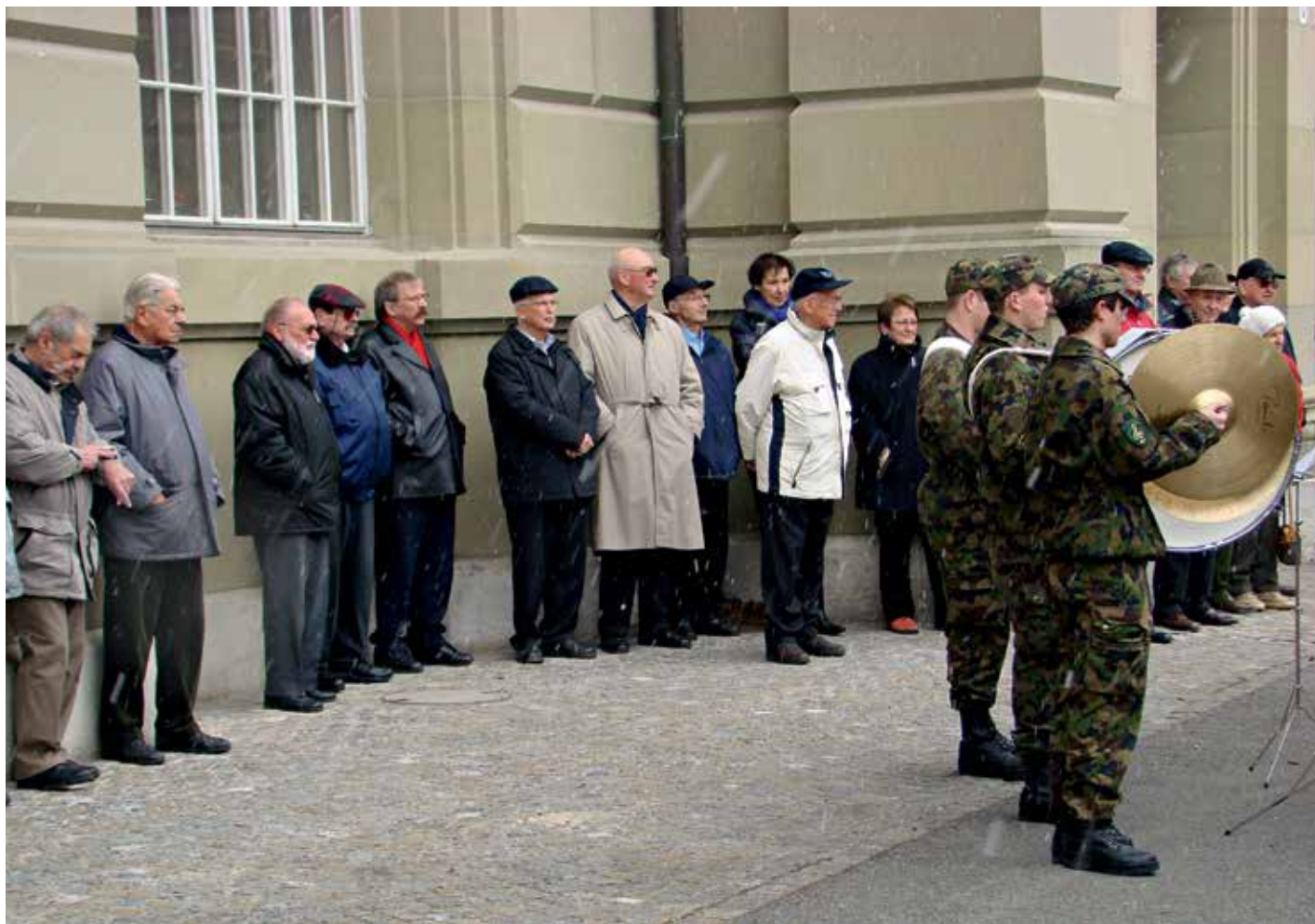
La nouvelle LCP : L'APEB exige une compensation du renchérissement sur les pensions.