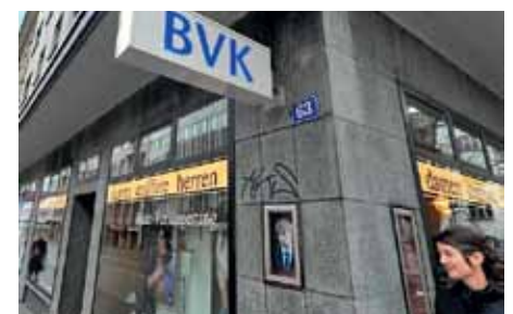
Höhere Beiträge, tiefere Leistungen.