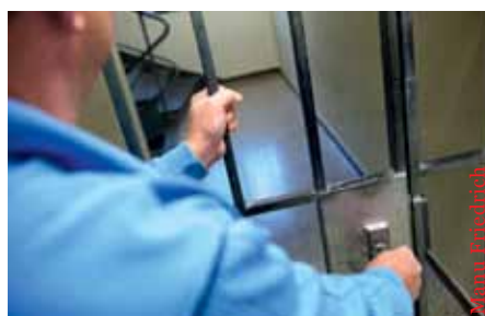
Zu wenig Gefängnispersonal.