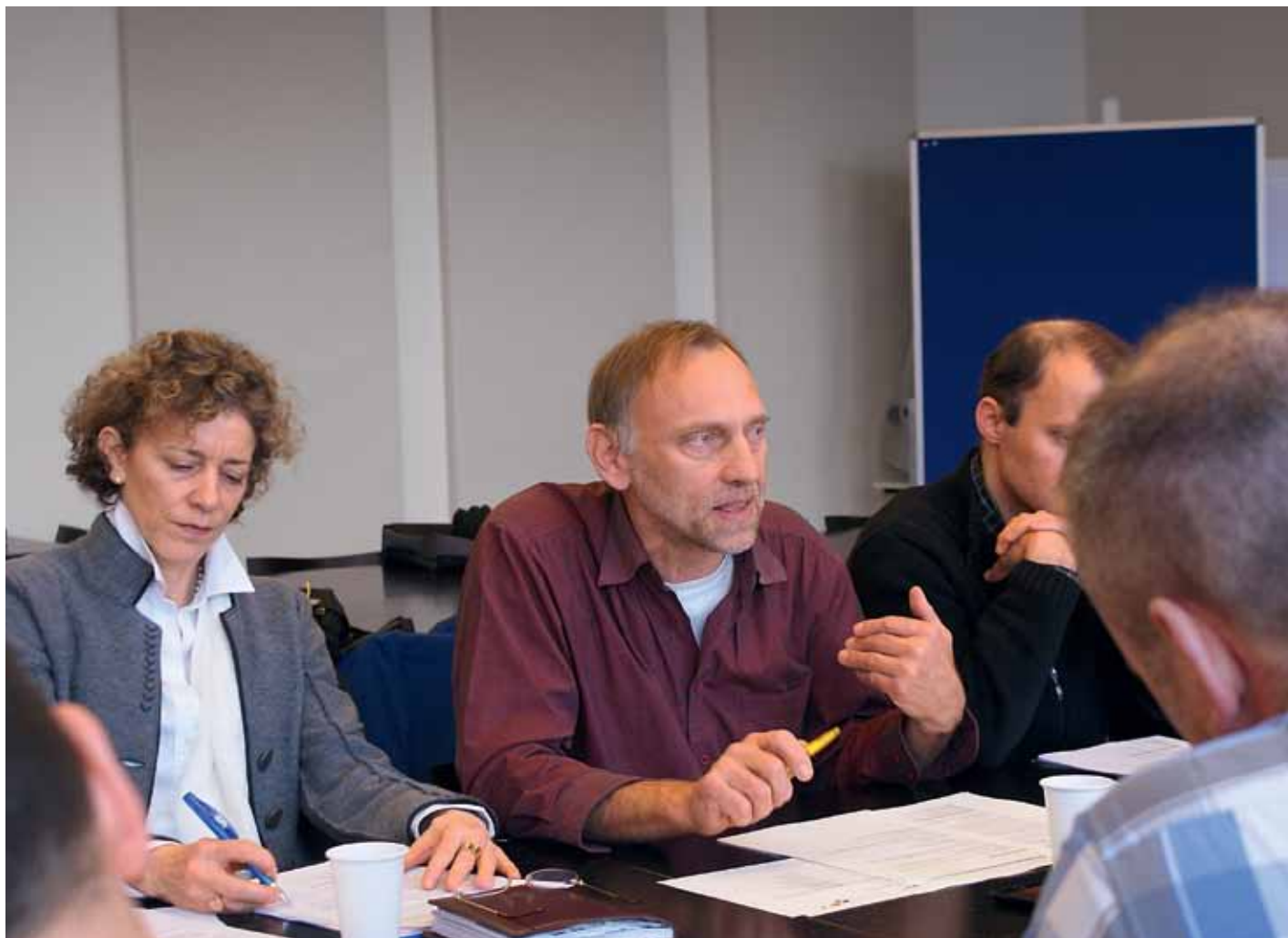
Trois échelons de traitement par an également pour le personnel cantonal.