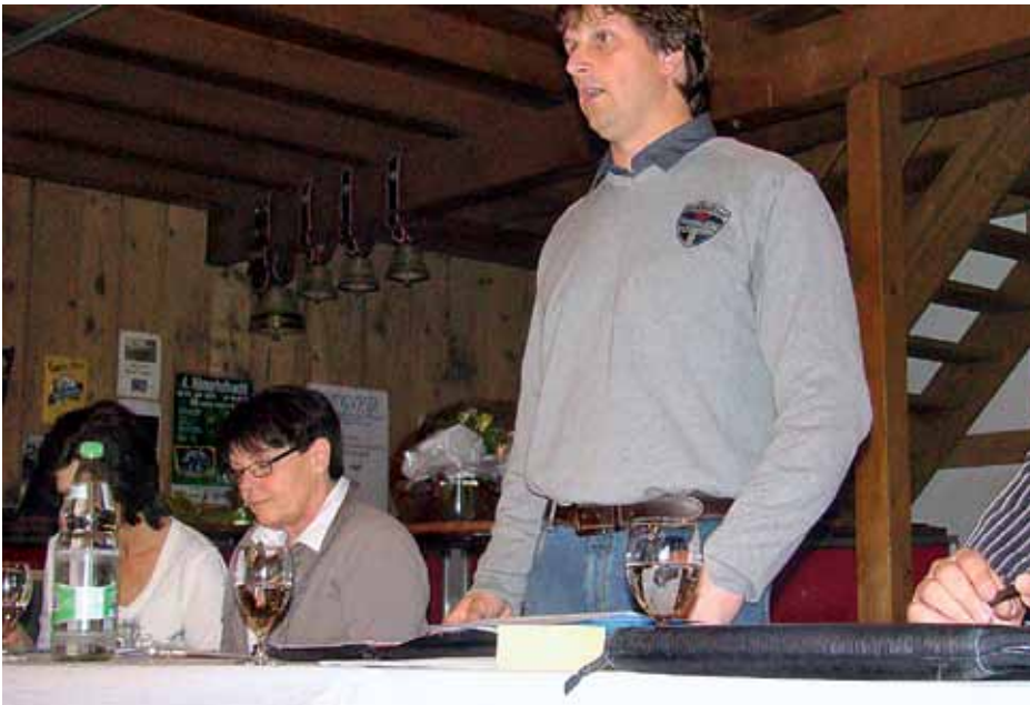
Die Betreibungsweibel beschliessen den Beitritt.

Im April haben zwei Berufsverbände beschlossen, sich dem BSPV anzuschliessen: Der Verband der Betreibungsweibel und die Dozierenden der Pädagogischen Hochschule Bern.