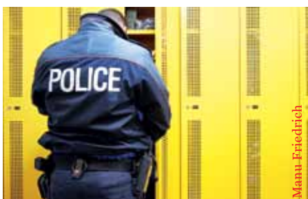
Genfer Polizisten wehren sich.

Die Pensionskasse der Zürcher Staatsangestellten BVK muss mit einer Einmaleinlage von 2 Milliarden Franken gerettet werden. Der Zürcher Kantonsrat hat sich für die Sanierung ausgesprochen. Damit soll der Deckungsgrad der BVK angehoben werden. Dieser liegt bereits im dritten Jahr in Serie unter der statutarisch vorgegebenen Mindesthöhe von 90%. Nicht nur der Kanton, sondern auch die Versicherten müssen bluten: Durch eine Statutenrevision sollen sie höhere Beiträge leisten und tiefere Leistungen in Kauf nehmen.