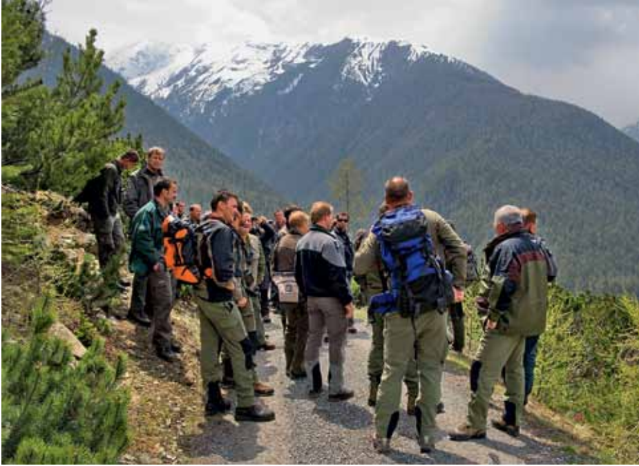
Wildhüter bei der Ausbildung.

Die kantonalen Wildhüter werden in eine höhere Gehaltsklasse eingereiht. Dies ist der Lohn für eine erfolgreiche Berufs- und Verbandsarbeit.