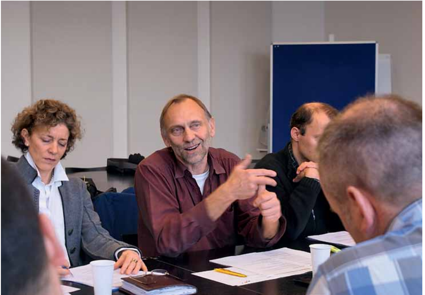
Drei Gehaltsstufen pro Jahr auch für das Staatspersonal.