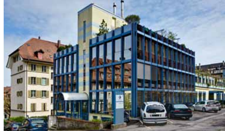
Aus der Hülfskasse entstanden: die Bernische Pensionskasse.

Nach dem Ersten Weltkrieg, am 15. Januar 1919, verabschiedet der Grosse Rat schliesslich ein Dekret über die Besoldung der Beamten und Angestellten der Staatsverwaltung. Am 30. September 1919 tritt das Bundesgesetz über die eidgenössische Hülfskasse in Kraft. Die Statuten dienen dem