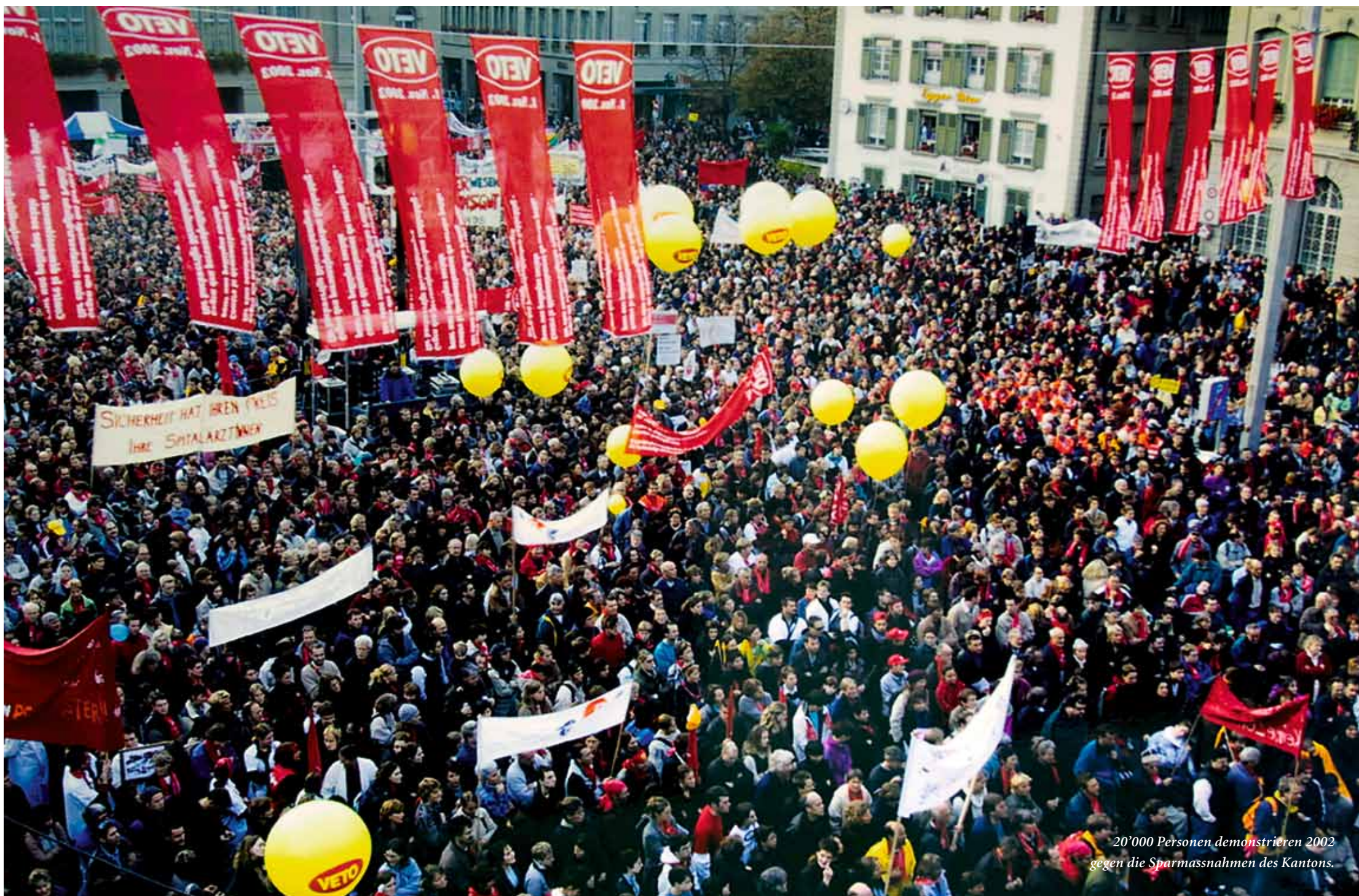
20'000 Personen demonstrieren 2002 gegen die Sparmassnahmen des Kantons.