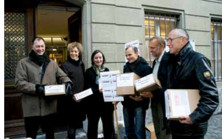
Gemeinsame Initiative der Berner Personalverbände BSPV, LEBE und vpod.

Wahlempfehlung von angestellte bern im Jahr 2011.