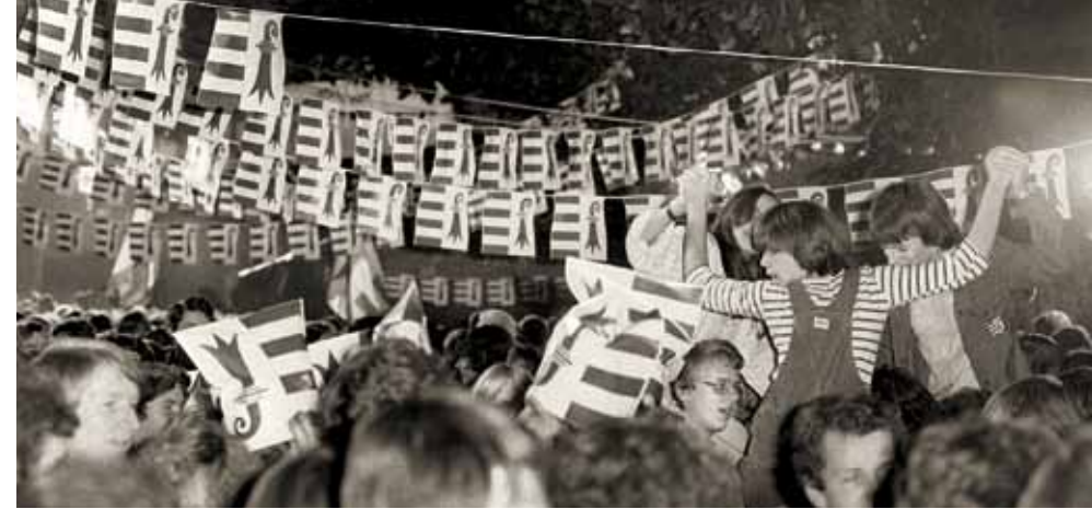
Grosser Jubel nach der Abstimmung. Am 24. September 1978 wird auf dem Delsberger «Freiheitsplatz» die Gründung des Kantons Jura ausgerufen.

Die erste Delegiertenversammlung der «Association du Personnel de la République et Canton du Jura» (APJU) findet im April 1979 statt, also drei Monate nach der