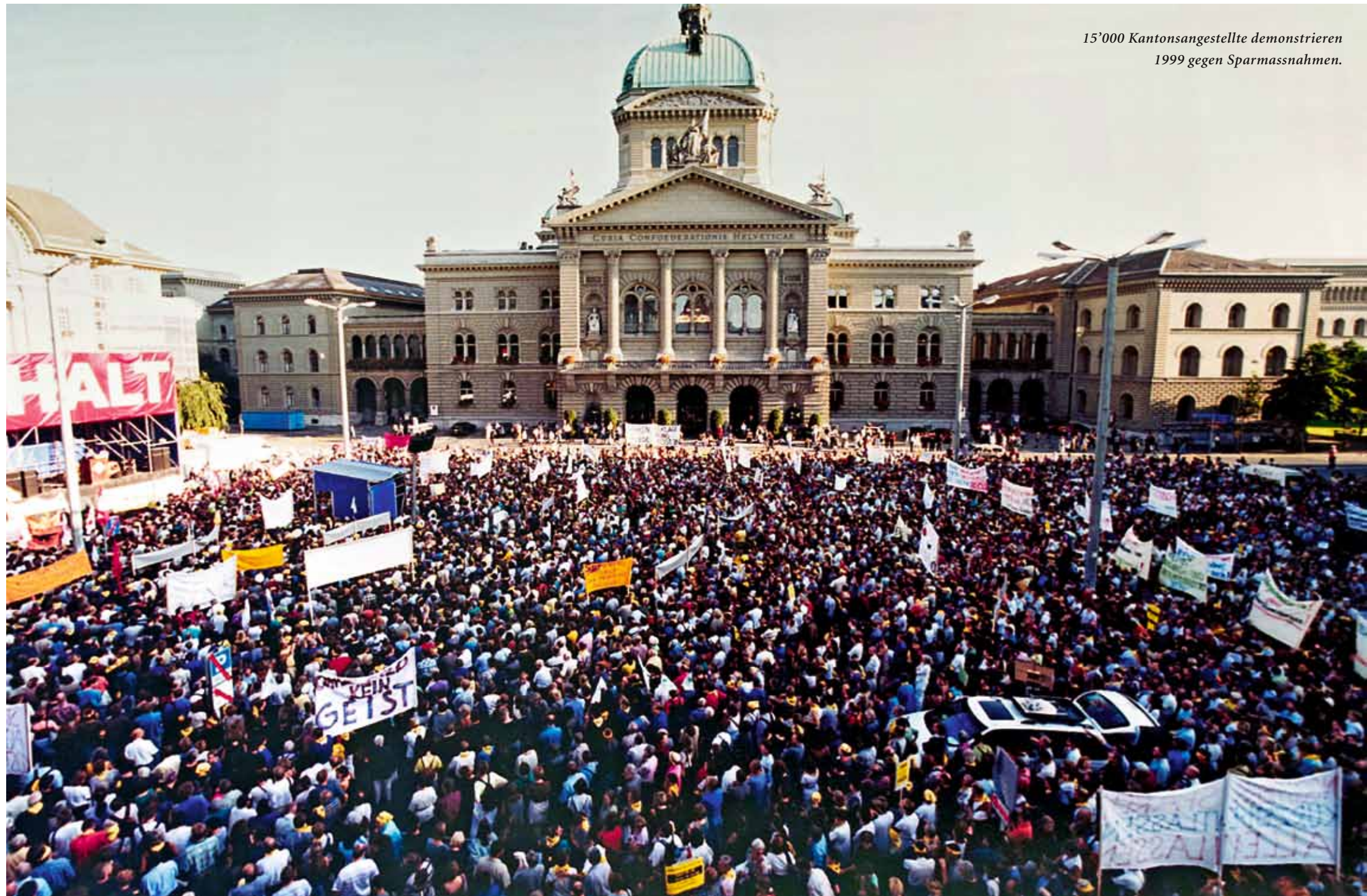
15'000 Kantonsangestellte demonstrieren 1999 gegen Sparmassnahmen.