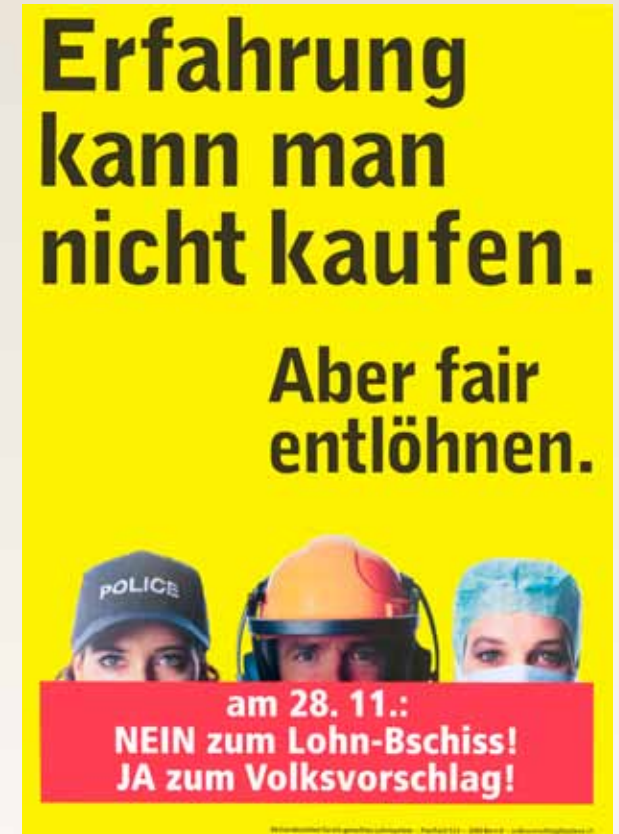
BSPV-Plakat zur Abstimmung vom 28. November 2004.