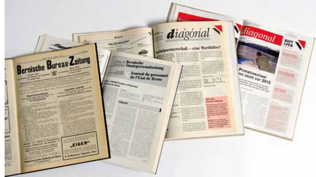
Von der «Bureau-Zeitung» zum «diagonal».

1939 wird der Redaktor im Zuge der Generalmobilmachung von der Armee aufgeboten. Eine Ausgabe entfällt.