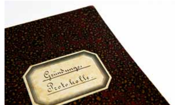
Das Gründungsprotokoll von 1912.