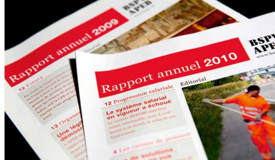
Die Verbandszeitschrift diagonal und der Jahresbericht erscheinen jeweils zweisprachig.

In den Sechzigerjahren scheinen die französischsprachigen Mitglieder vorübergehend aktiver an der Verbandsarbeit teilzunehmen. Die Redaktoren der