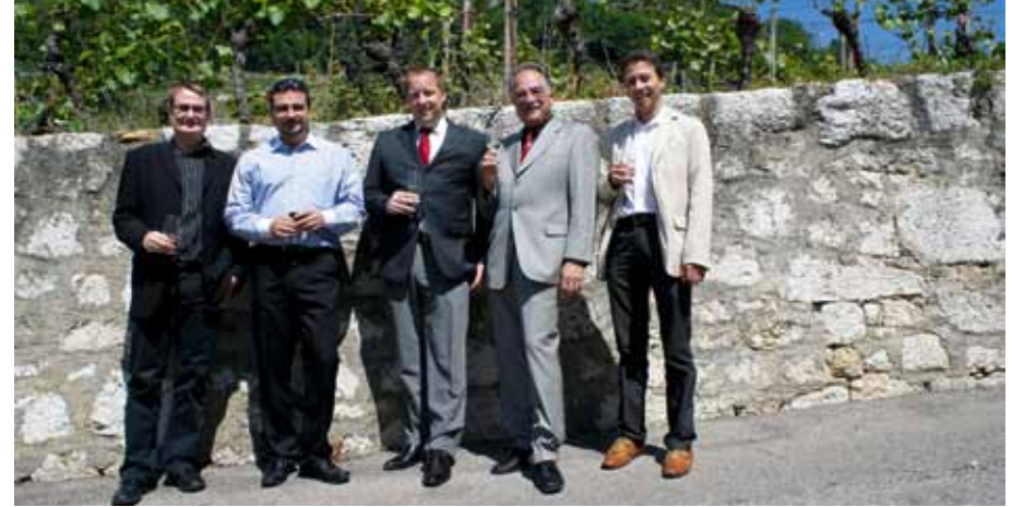
Der VBKBIS-Vorstand an der Jahresversammlung vom 13. Mai 2011 in Twann.

1948 gehören erstmals alle aktiven Betreibungs- und Konkursbeamten des Kantons Bern dem Verband an. Die Mitglieder diskutieren an ihren Versammlungen vor allem Fachfragen, meist in Anwesenheit hohen Besuchs aus Regierungsrat, Justiz oder Verwaltung. Am 3. April 1970 beschliessen 21 versammelte Mitglieder, aus dem damaligen Verband bernischer Bezirks- und Kreisbeamter auszutreten (letzterer löst sich dann 1991