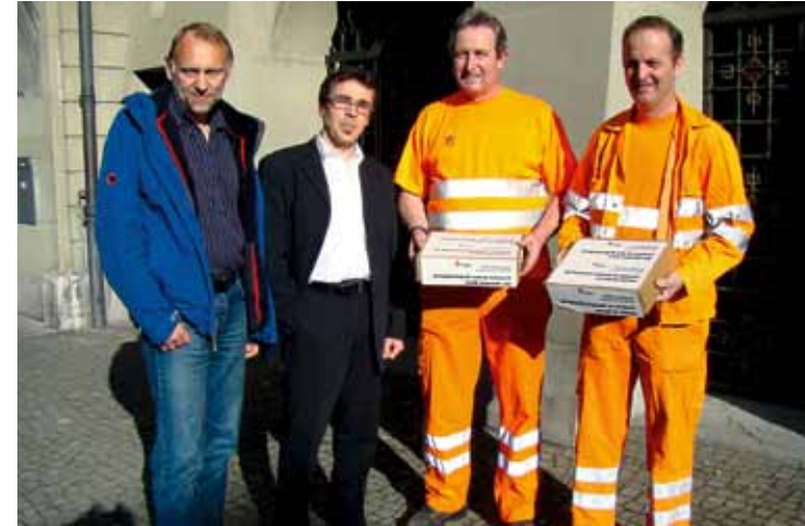
Die Strassenmeister reichen im März 2011 eine Petition für faire Zeitgutschriften ein.

Bereits 1919 treten einige Sektionen von Wegmeistern dem BSPV bei. Obwohl sie zahlenmässig sehr stark sind, zögern sie lange, dem BSPV beizutreten. Sie fürchten, als einfache Arbeiter unter dem bessergestellten Staatspersonal kein Gehör zu finden. In der Festschrift zum 25-Jahre-Jubiläum des BSPV heisst es dazu: «Bei einer Organisation von Vorgesetzten und Arbeitern, von Beamten und untergeordneten Angestellten wird es als selbstverständlich angenommen, dass in erster Linie die Interessen der Oberschicht gewahrt werden müssen.» Trotz dieser Bedenken schliessen sich am 10. März 1923 die zahlreichen Untergruppen zu einem kantonalen