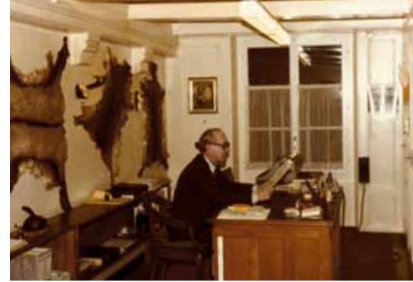
Altes Büro an der Kramgasse.

Vor dem Umzug an die Postgasse war das Verbandssekretariat an drei verschiedenen Standorten in Berns Innenstadt domiziliert: Ab 1923 gibt es erstmals ein vollamtlich geführtes Verbandssekretariat. Es wird von Willy Luick geführt und befindet sich am Waisenhausplatz 6 im 3. Stock. Schon bald steigen die Ansprüche