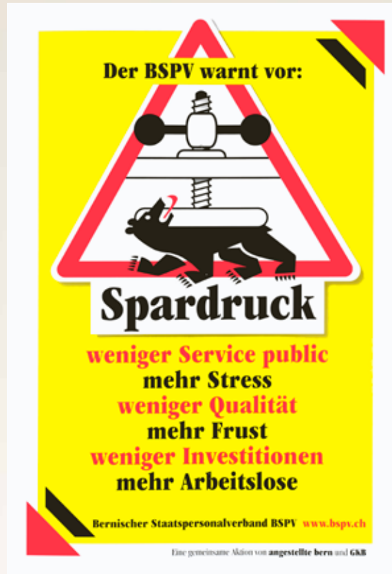
BSPV-Plakat zur «Warnstunde» vom 11. November 2003.