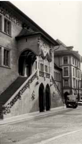
Berner Rathaus um 1912.

Rund vierzig Beamte und Angestellte beschliessen, den BSPV zu gründen. Es zeigt sich: Sie treffen den Nerv der Zeit.