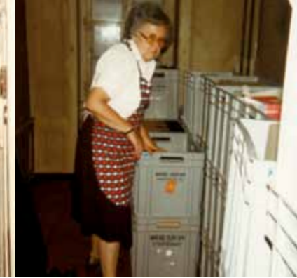
1984: Umzug an die Postgasse.

an den Platz – erst mit dem Anwachsen der Archivbestände, dann mit dem Bedarf an zusätzlichem Personal. 1930 folgt der Umzug an die Marktgasse 50, auch dort im 3. Stock. Im November 1946 werden dann neue Räume an der Kramgasse 70 Bern bezogen. Dort bleibt das Sekretariat während 38 Jahren.