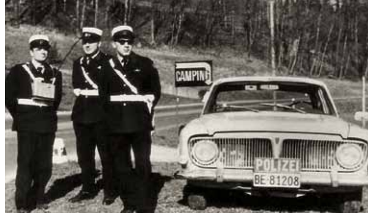
Verkehrskontrolle um 1960.

Um ihre Existenz bestreiten zu können, sind die «Polizeier» auf Nebenverdienste angewiesen. Mit diesem Problem befasst sich der Vorstand gleich nach der Polizeiverbandsgründung. Er stellt der Regierung entsprechende Anträge auf Lohnerhöhung. Aber auch in ideeller Hinsicht führt der Verband einen harten